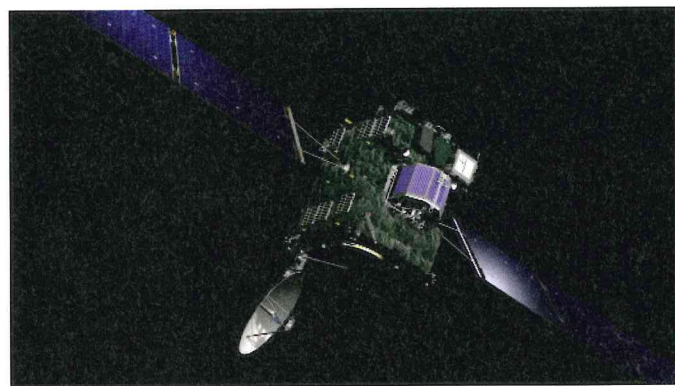
Rosettasonde mit Philae-Lander an Bord.

SA am Goldstone Deep Space Communications Complex in Kalifornien das erste Lebenszeichen. Erleichterung und Freude war im